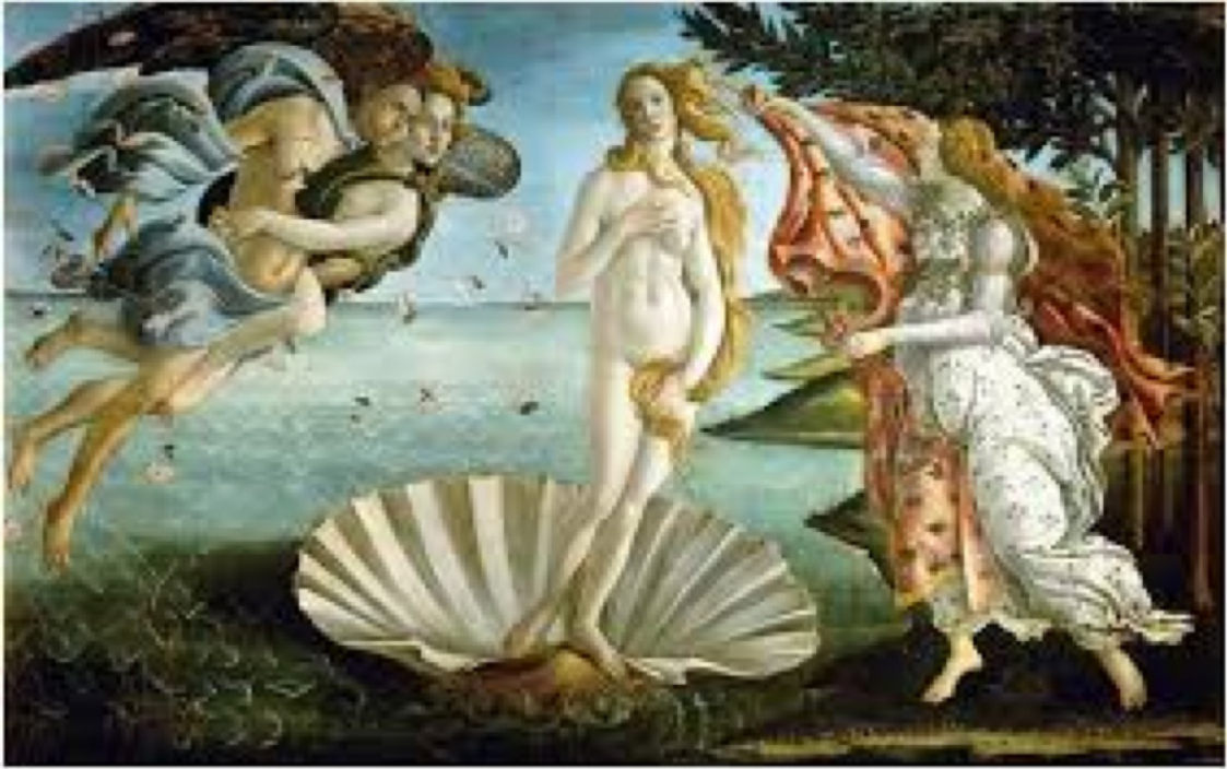
O Nascimento de Vênus, de Sandro Botticelli, pintado por volta de 1485.