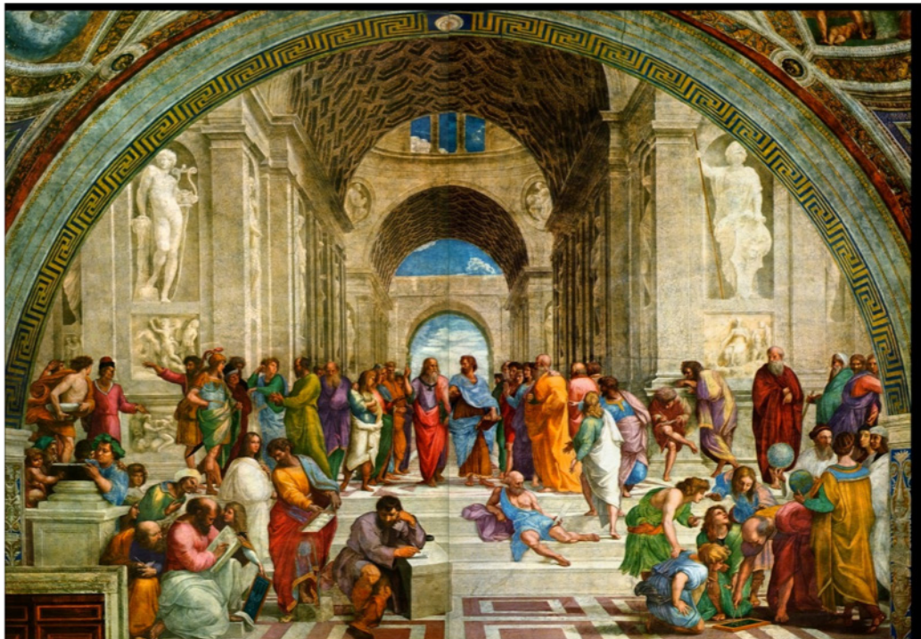
A Escola de Atenas, de Rafael Sanzio, pintado entre 1509 e 1511.