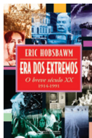
Companhia das Letras

O livro aborda elementos históricos que ocorreram durante o século XX, o qual, segundo Hobsbawm, foi curto, mas repleto de conflitos, desde a Primeira Guerra Mundial, em 1914, até a queda da União Soviética, em 1991. Há também análises de variados elementos culturais que permeiam o século XX.