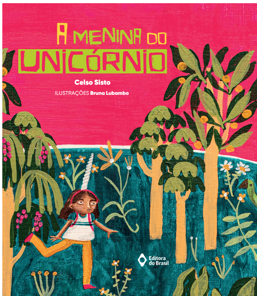
Celso Sisto Ilustrações de Bruna Lubambo